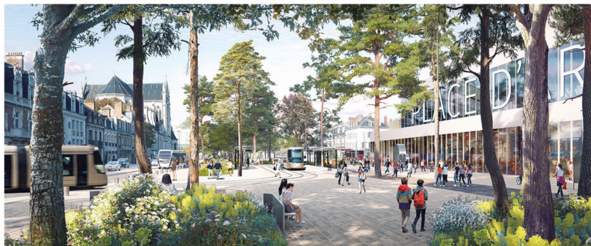
Place d'Arc, devant la gare, la dalle sera déconstruite pour retrouver le sol et le planter.

Entre la place de l'Université et les berges de Loire, le projet de Richez_Associés met en scène l'arrivée de la promenade et l'ouverture vers les paysages grandioses de la Loire à travers un paysage de prairies naturelles séquencées en terrasses. Cet aspect champêtre assumé vise à faire entrer en résonance le mail avec le paysage sauvage ligérien. (MCV)