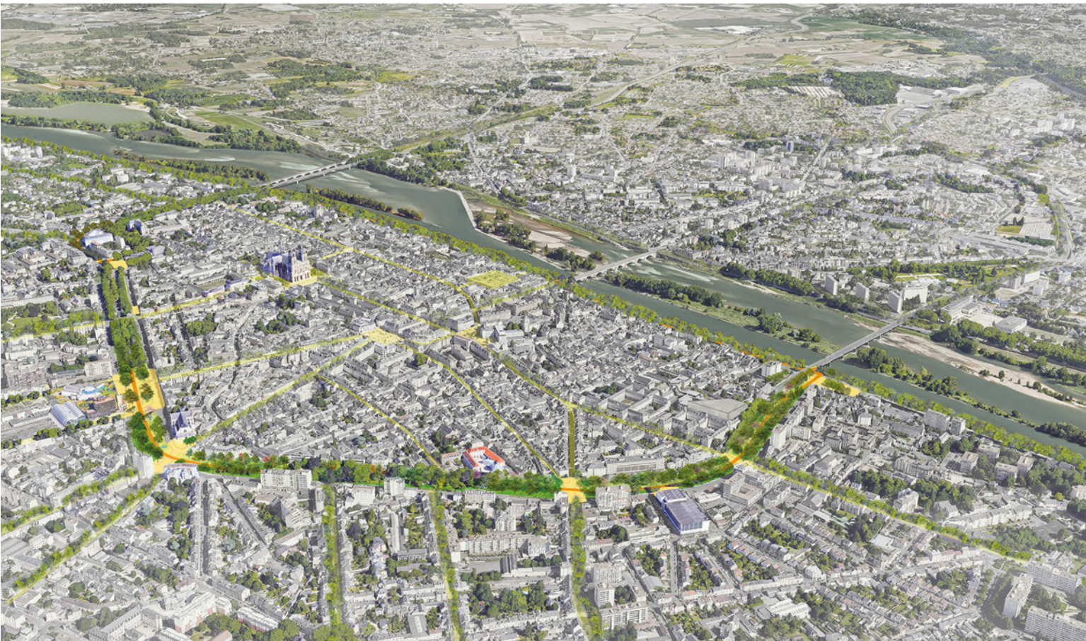
Une promenade de la Loire à la Loire. © Richez_Associés

La promenade des Mails qui se développe de la Loire à la Loire, se structure en six séquences urbaines et paysagères : le Mail des Terrasses, du Pont Joffre au Parvis de l'Université, met en scène le grand paysage au travers d'une succession de terrasses et d'espaces en pente ; le Mail Intense, qui déploie de part et d'autre de la place Madeleine de grandes pelouses ouvertes et des espaces sportifs, entre l'université, la patinoire et la place Saint-Jean ; le Mail Culturel, qui étend le square historique Rocheplatte du Frac à l'avenue de Paris, et y développe des espaces paysagers jardinés à forte valeur écologique