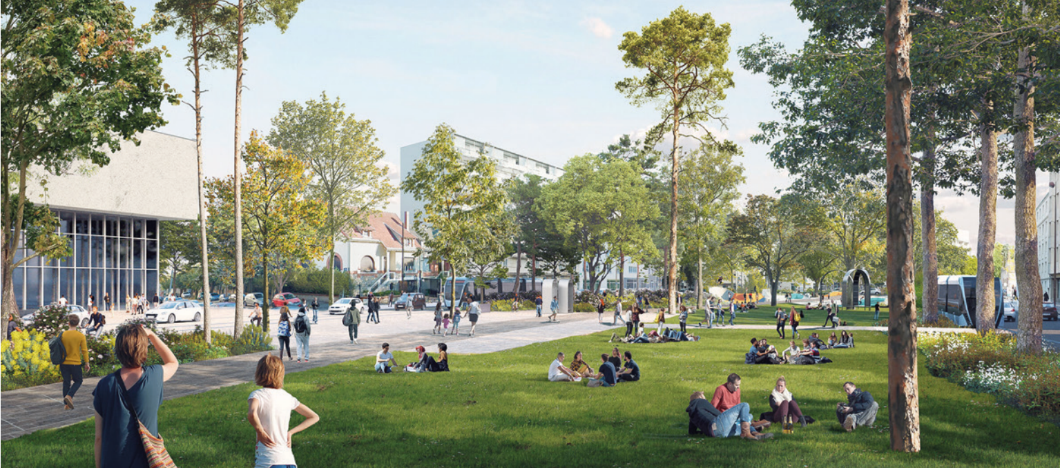
Mobilités douces et espaces apaisés. © Richez_Associés

et arboricole ; le Mail Interconnecté, qui ancre la gare et le Centre Commercial Place d'Arc sur une grande place et l'ouvre sur le centre-ville ; les Mails Événementiels, qui accueillent des esplanades festives et des jardins sériels sous les grands alignements historiques de la rue Albert 1 er à la place Charles Péguy ; le Mail Belvédère, qui déploie de la place Charles Péguy au pont Thinat une promenade en hauteur et offre des vues en balcon sur la ville et sur la Loire.