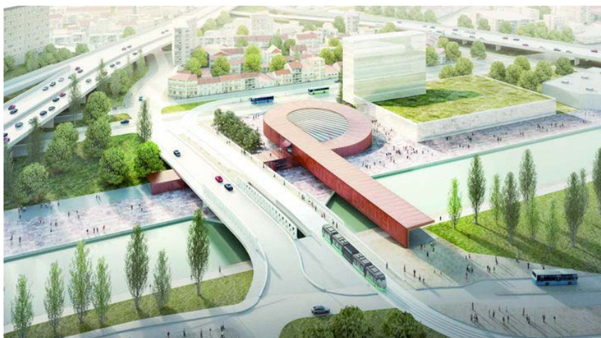
Gare du pont de Bondy, par BIG et Silvio d'Ascia. © BIG - Silvio d'Ascia

Les dix dernières ayant été attribuées début novembre 2016, les 68 gares du Grand Paris Express sont désormais dotées d'une équipe de maîtrise d'œuvre (voir le plan ci-dessus). Les derniers marchés concernent le tronçon est de la ligne 15 entre Saint-Denis Pleyel et Champigny. Parmi eux, la gare du pont de Bondy, au croisement de l'A3, de l'A86, de la RN3 et du canal de l'Ourcq, labellisée "gare emblématique", a fait l'objet d'un concours spécifique, remporté par l'agence BIG associée à Silvio d'Ascia. Le marché de maîtrise d'œuvre du génie civil pour les 23 kilomètres de tunnels et les dix gares a été confié au groupe d'ingénierie Egis. La mise en service de ce tronçon est de la ligne 15 s'effectuera en deux phases, en 2025 et 2030, pour un investissement total de 3,5 milliards d'euros. Mais c'est sur le secteur sud de cette même ligne 15, entre le pont de Sèvres et Noisy-Champs, que le chantier du Grand Paris Express a vraiment démarré en 2016 par le creusement des tunnels. En 2017, les 16 gares de ce tronçon seront en chantier pour une mise en service attendue en 2022.