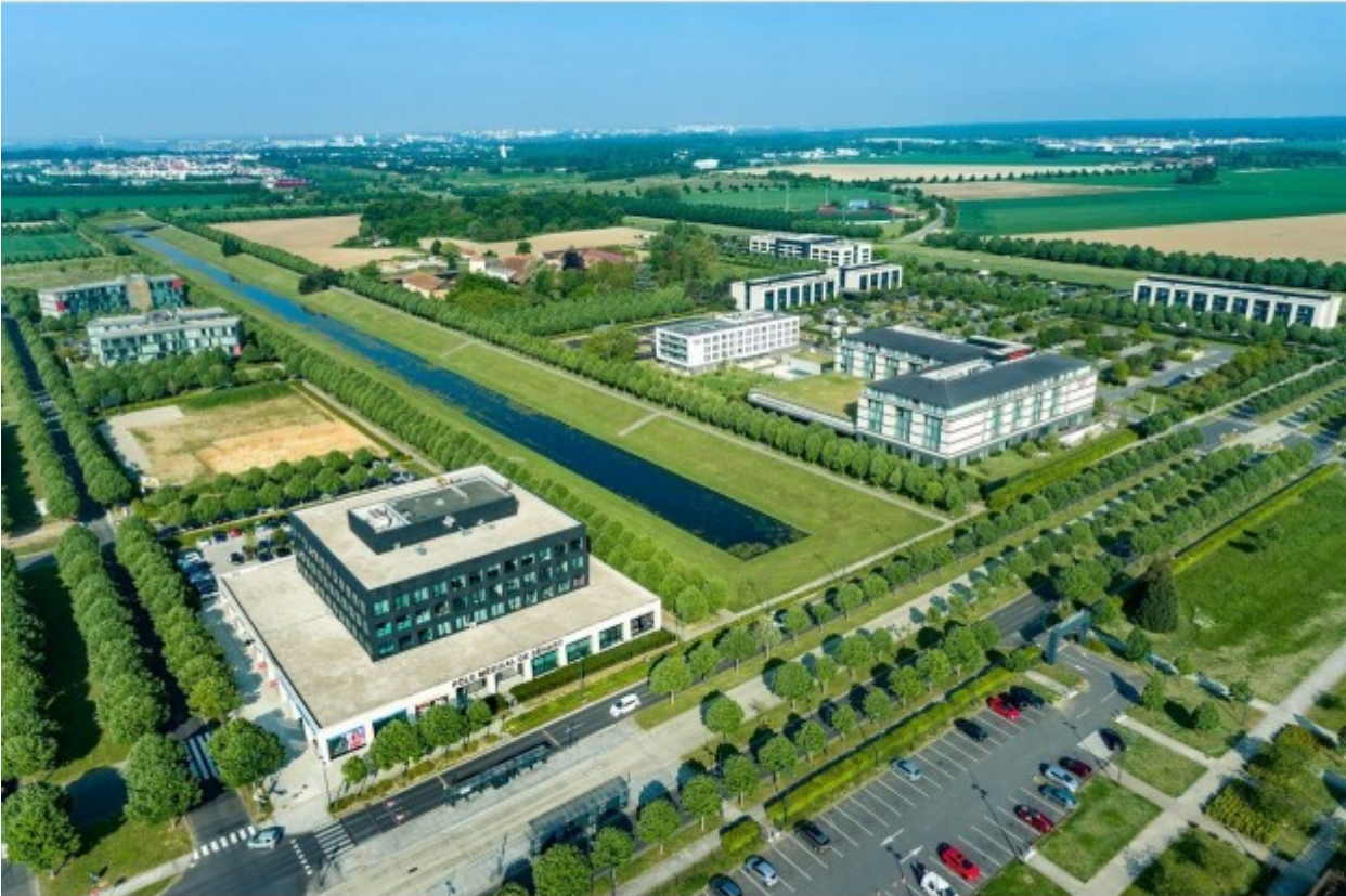
Le Carré Sénart.

OIN SENART. L'aménageur de l'ancienne Ville nouvelle de Sénart, au sud-est de Paris, a fait appel, pour la première fois, à une maîtrise d'œuvre urbaine externe, pour la suite de l'aménagement du Carré Sénart, centralité de l'Opération d'intérêt national.