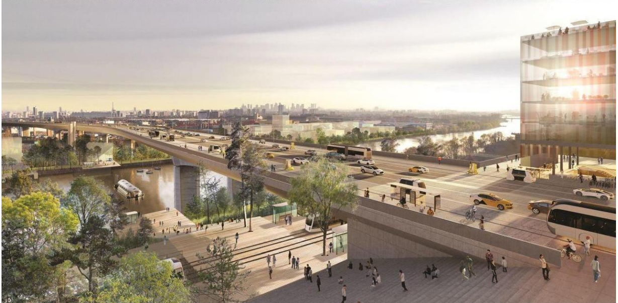
Projection sur le viaduc de Gennevilliers sur l'A15 (Collectif Holos.)

Là aussi, il s'agit de faire des autoroutes « multimodales », avec des transports en commun, du covoiturage, etc.. pour augmenter le nombre d'usagers de l'infrastructure... et ainsi réserver certaines voies aux livraisons et besoins vitaux (santé, déchets alimentaires).