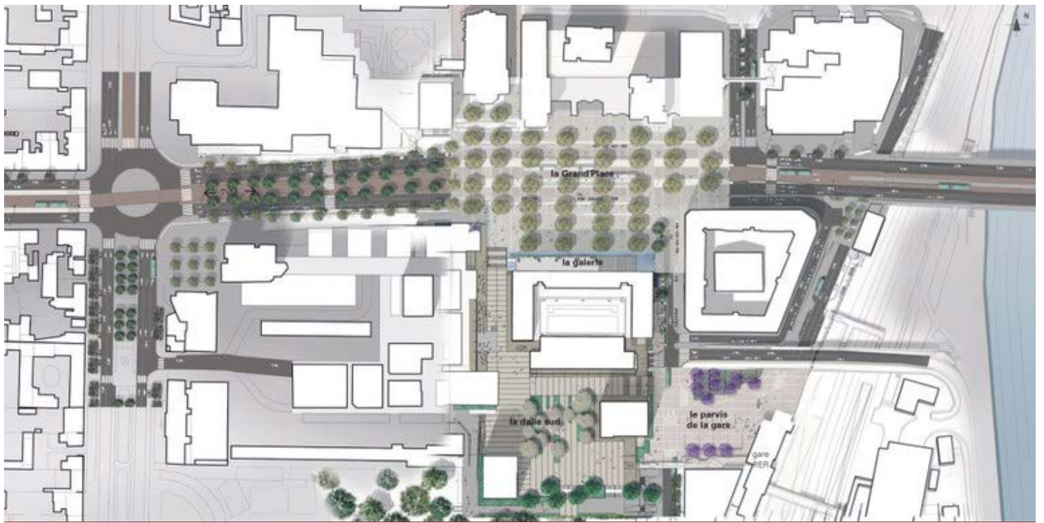
Projet de station Rouget-de-Lisle du tramway T9 - cliquer pour agrandir