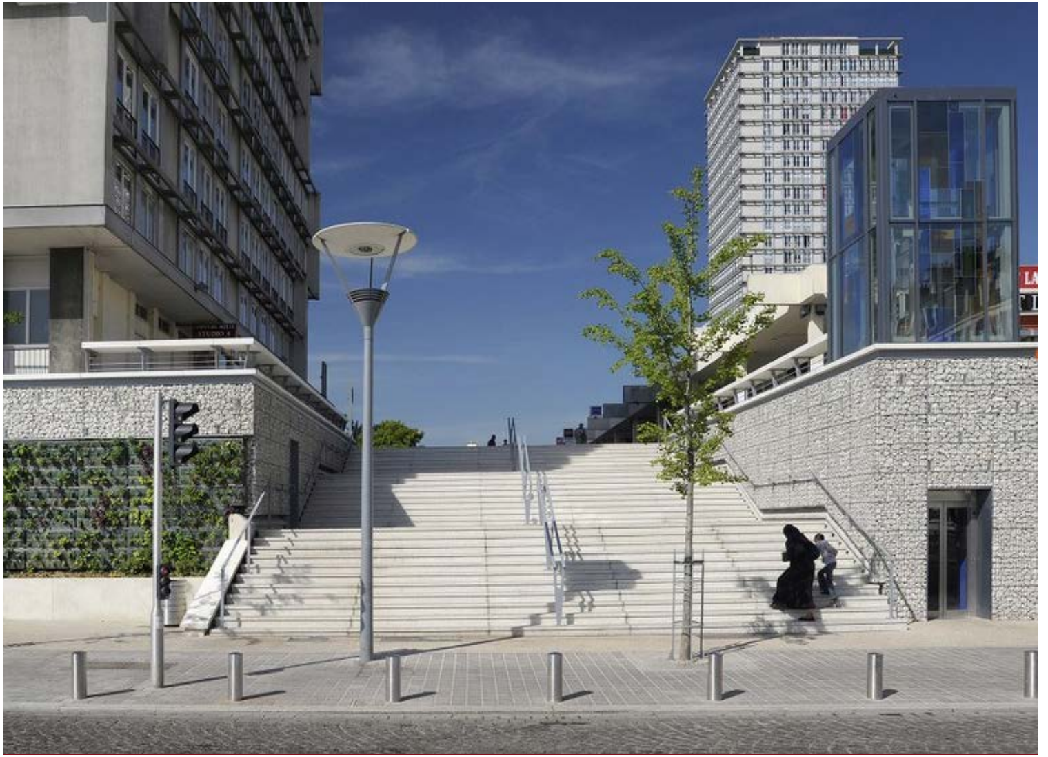
Le nouvel escalier vers la dalle, côté gare- cliquer pour agrandir